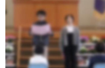
先生の顔を見て、しっかりと話を聞くことができます！